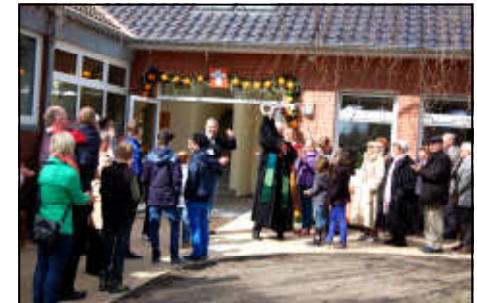
Bauen und Sanieren

Stiftung Pauluskirche IBAN: DE16 2855 0000 0006 8116 08 Sparkasse Leer VWZ: Zustiftung zur Stiftung Pauluskirche