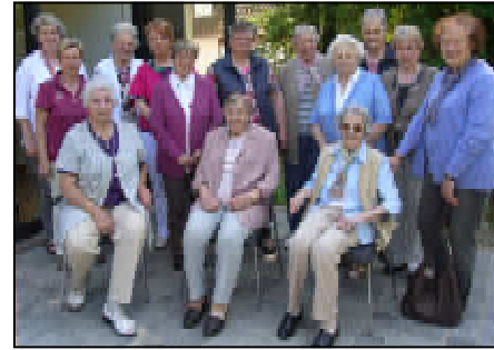
Arbeit mit der älteren Generation