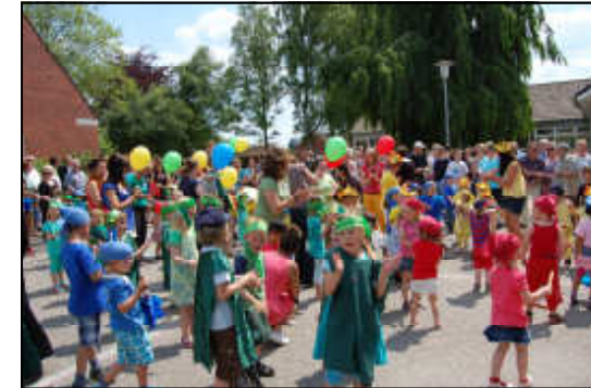
Einweihung der Krippe und Sommerfest des Kindergartens