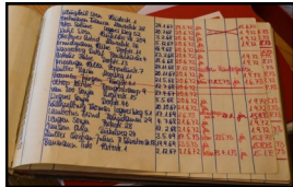
Das erste Anmelde- u. Aufnahmebuch des Kindergartens (ab 1972 angelegt und geführt).

(Wie klein und zierlich die Birken damals noch waren.)