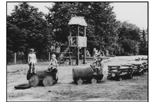
Die auf diesen beiden Fotos zu sehende Spielgeräte haben die Eltern in den Jahren 1974 / 75 aufgebaut: Sandkastenumrandung, Zug, Aussichtsturm, Schiff, Spielhütte